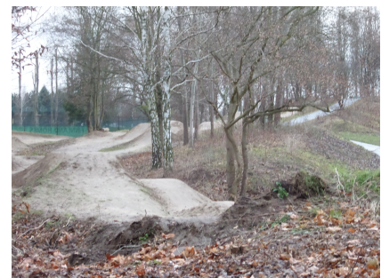
Die fertige Strecke.