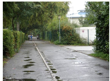
Der Weg zwischen Bettina von Arnim-Schule und Seniorenzentrum vor der Umgestaltung