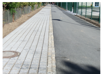
Die Zuwegung zur Schule nach der Umgestaltung