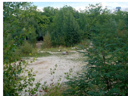
Die sogenannte Bettina-Brache vor Projektbeginn