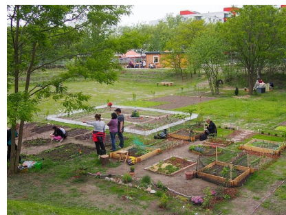
Der Nachbarschaftsgarten blüht auf