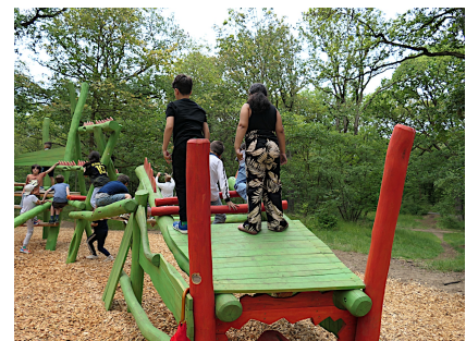
Der große Kletter-Drache bietet Spaß auf vielen Ebenen