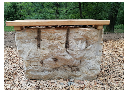
Den Sandstein zum Sitzen gestalteten Kinder in einem Workshop