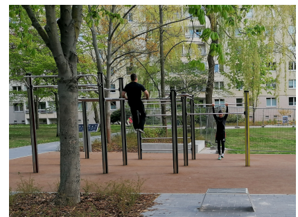
Neu ist u.a. die Calisthenics-Anlage