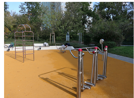
Eine Fitness-Insel mit robusten Geräten ist neu entstanden