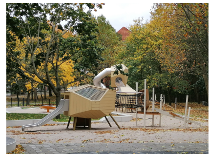
Der Spielplatz "Universum, Raum und Zeit" mit Spielgeräten für verschiedene Altersgruppen