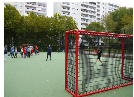
Der erneuerte Bolzplatz mit geräuschkindernder Ausstattung