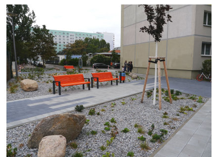
Die umliegende Grünfläche wurde als Treffpunkt neu gestaltet