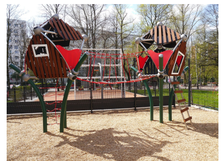
Das Klettergerät "Baumhaus" auf dem neu gestalteten Außengelände des Schülerladens