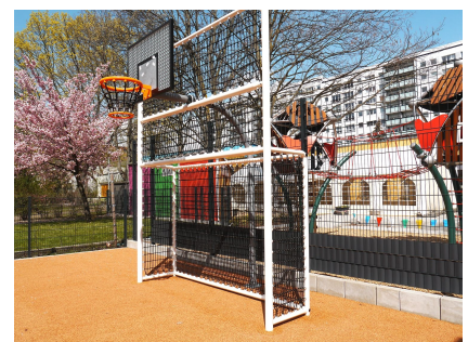
Eines der neuen Bolzplatztore hat einen Basketballaufsatz