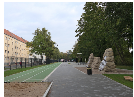
Das Sportband an der Ruschestraße