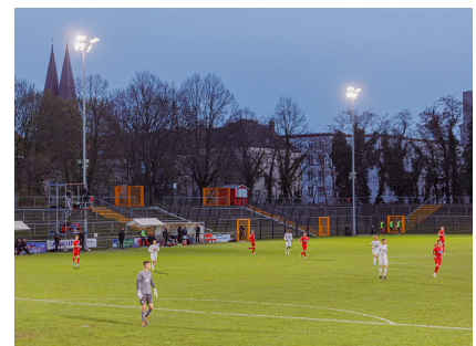
Die Howoge-Arena "Hans-Zoschke" mit Flutlicht