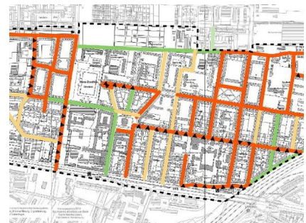
Starker Parkdruck mit Falschparkern - Teil einer Grafik aus dem Konzept von Steinbrecher u. Partner