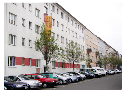
In der Hagenstraße stehen PKWs dicht an dicht