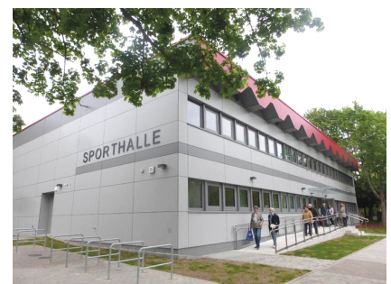
Die Sporthalle am Nibelungenpark ist komplett saniert