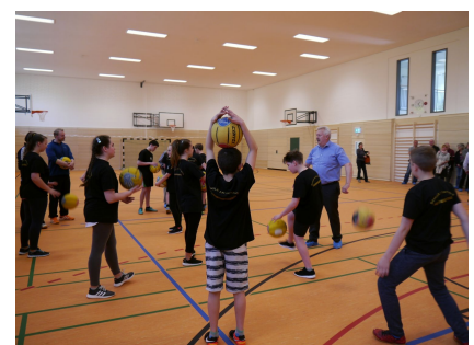
Die erste Sportstunde in der neuen Halle