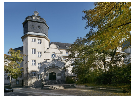
Zur Wiederherstellung des historischen Bildes ist noch die Sanierung der Freitreppe nötig