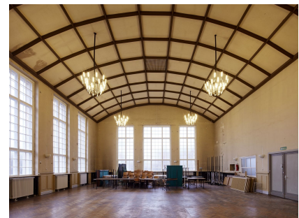
Die historische Aula vor der Sanierung