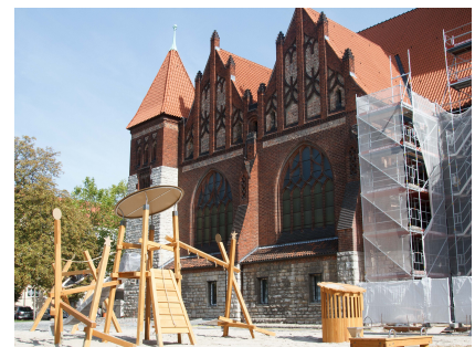
Der neue Spielplatz an der Koptischen Kirche auf dem Roedeliusplatz