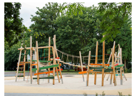
Paradiesspielplatz für größere Kinder

Stand: April 2024