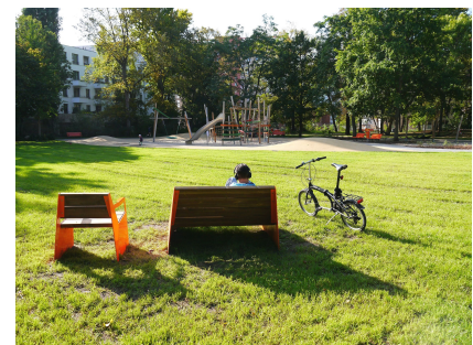
Loungemöbel auf der großen Wiese mit Blick auf den Spielplatz