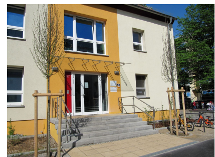
Der Eingangsbereich des Bestandsgebäudes wurde ebenfalls neu gestaltet

Stand: April 2024