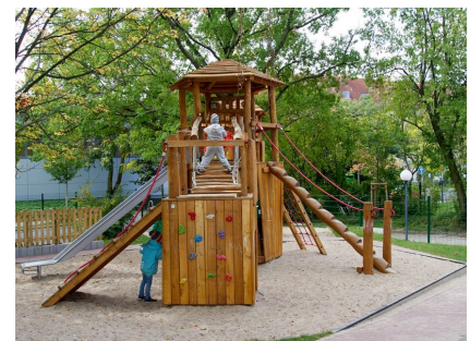
Das neue Klettergerüst für die Größeren