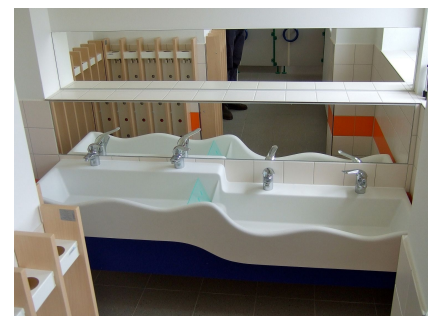
Waschbecken für groß und klein