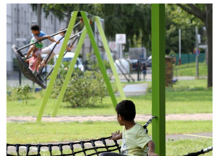
Hängematte und Schaukeln im Garten