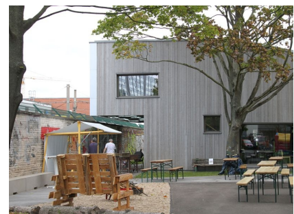
Neben der Terrasse ein Grillplatz mit Selbstbaumöbeln für die Jugendlichen