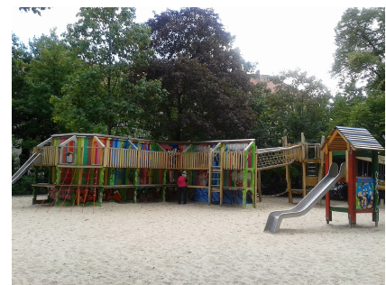
Die Kletterlandschaft wurde behutsam ergänzt