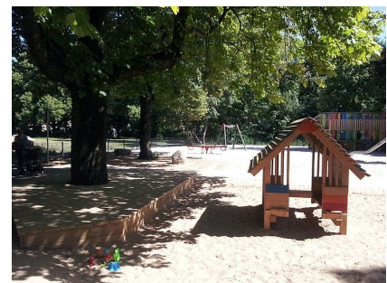
Der schattige Spielbereich für die Kleinkinder