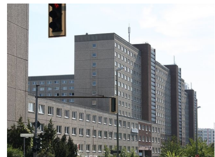
An der Ruschestraße bildet der Block eine massive Barriere