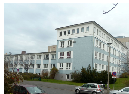
Ein Gebäude aus den 1950er-Jahren im Blockinneren

Quelle: Stattbau GmbH u. Bezirksamt Lichtenberg, Grafik: Stattbau, Foto 2: Bezirksamt Lichtenberg, Foto 3 u. Bearb.: A. Stahl Stand: April 2024