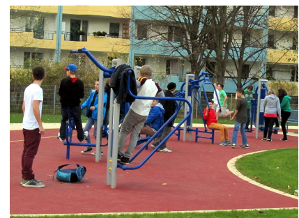
Auch Outdoor-Fitnessgeräte gehören zur neuen Ausstattung