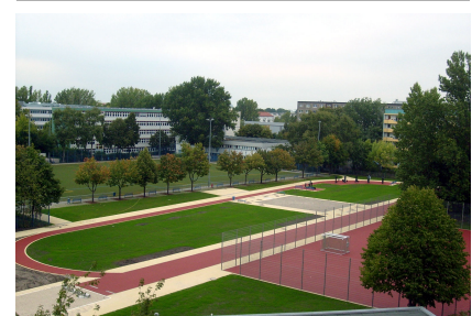
Der Spielplatz wurde komplett saniert