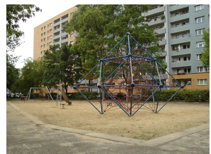
Der "Spinnenspielplatz" vor der Aufwertung