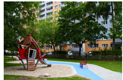
Anregende Farben, modernes Design: hier der Kleinkindspielbereich