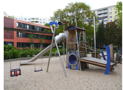
Der kleinere Kletterturm mit Rutsche