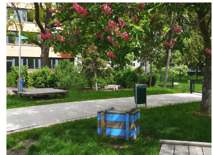
Grünfläche mit zusätzlichen Spielmöglichkeiten