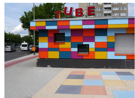
Das Muster am Jugendklub Tube wurde im Bodenmosaik aufgenommen