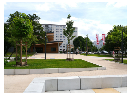
Vom Jugendklub führt eine Schräge zum Supermarkt. Am Klub gibt es ein kleines Atrium mit Sitzstufen