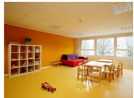
Ein Gruppenraum der neuen Kita