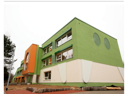
Das Gebäude erinnert an ein Krokodil