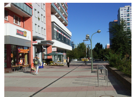
Die erneuerte Promenade