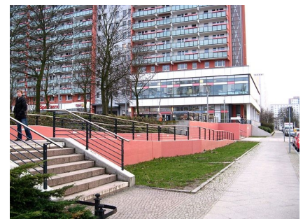
Der neue Zugang mit Treppen- und Rampenanlage an der Landsberger Allee