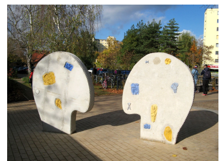
Kunst von Schülern als identitätsstiftendes Zeichen am Eingang