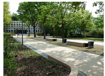
Die neue Mittelachse verbindet die Schulgebäude