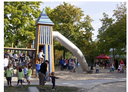
Der Spielplatz Hermann-Schmidt-Weg wurde komplett erneuert