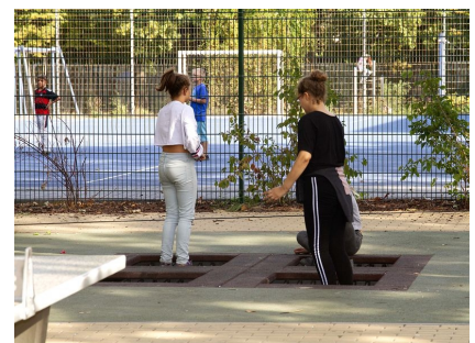
Trampoline, Tischtennis und ein Bolzplatz für die Größeren