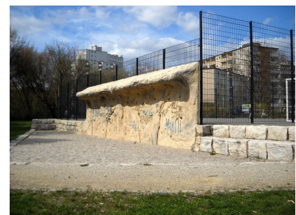
Boulderwand auf dem Jugendspielplatz