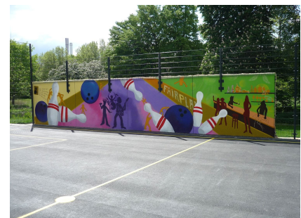
Die Rückseite der Boulderwand am Bolzplatz gestalteten Jugendliche der B.-Traven-Schule