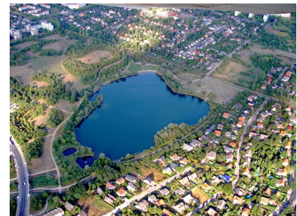
Der See im Falkenhagener Feld aus der Vogelperspektive