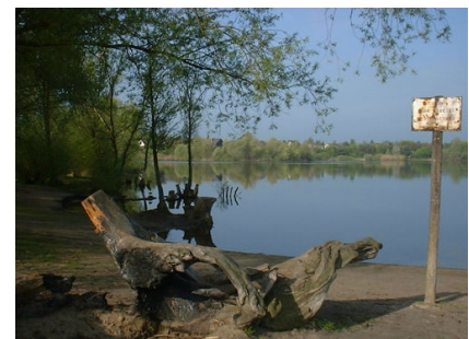
Verbotsschild am Seeufer