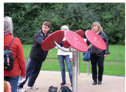
Ein Trainer erklärt mögliche Übungen im Sportanfänger-Bereich

Text: Planergemeinschaft Kohlbrenner eG, bearb. A. Stahl, Fotos: Planergemeinschaft (1), Bezirksamt Spandau (2, 3) Stand: April 2024