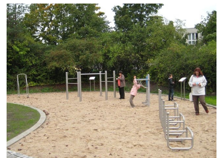
Der anspruchsvolle Fitnessbereich