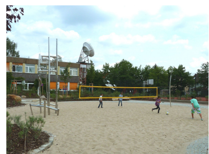
Ein Beachvolleyballfeld für die Schule mit Schwerpunkt Sport