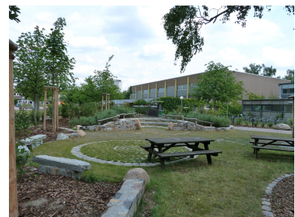
Grillplatz und Amphitheater als grüne Kommunikationsorte