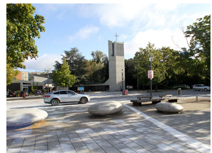
Blick über den Platz in Richtung Zufluchtskirche