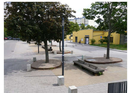
Der Quartiersplatz vom Klubhaus aus gesehen