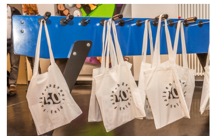
Jutetaschen zum Jubiläum