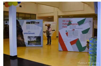
Die Ausstellung im Klubhaus Westerwaldstraße