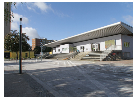
Das Klubhaus am Quartiersplatz Westerwaldstraße