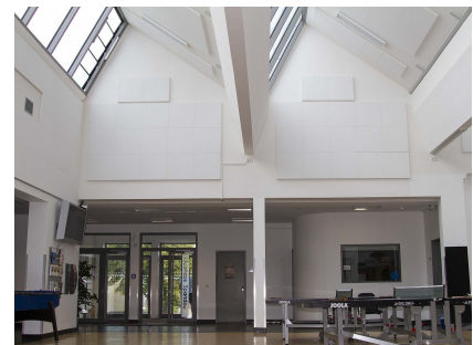
Der zentrale Mehrzweckraum mit den neuen Oberlichtern