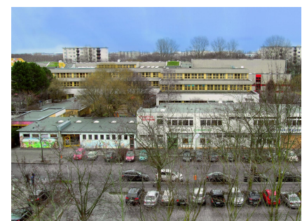
Heute wird noch viel Platz im Zentrum als Parkraum genutzt. Zu sehen sind das Stadtteilzentrum mit dem Jugendclub (rechts) und der Kita (links) am Halemweg, dahinter das alte Gebäude des Oberstufenzentrums