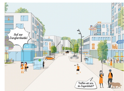
Die Perspektive für das neue Zentrum Jungfernheide am verkehrsberuhigten Halemweg nach dem Leitbild "Urban Light" © Studio Schulz Granberg/bbz Landschaftsarchitekten