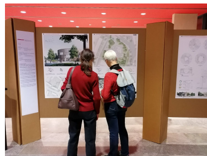
Ausstellung zum Wettbewerb vom 20. November bis 5. Dezember 2019 im Hermann-von-Helmholtz-Gebäude des Max-Delbrück-Centrums Buch