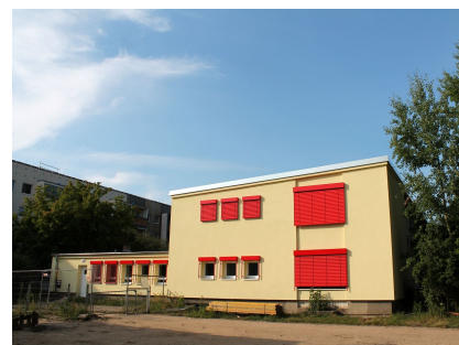
Der sanierte Südwestgiebel mit Sonnenschutz