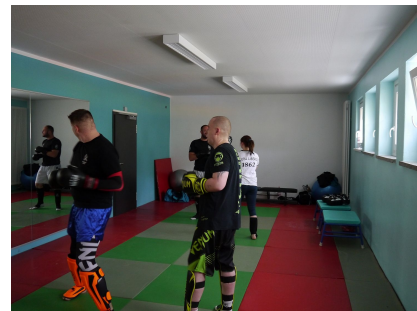
In den Innenräumen dominieren farbige Wände und Bodenbeläge - wie hier im Kampfsport- und Tanzraum