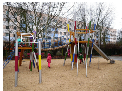
Die neue Kletterkombination im Mikadostil