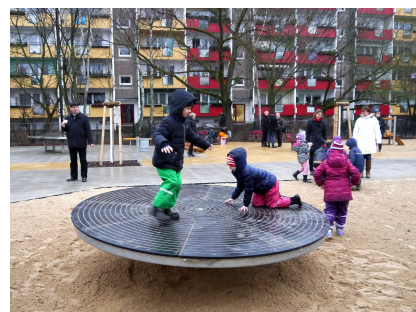
Die Drehscheibe war ein besonderer Wunsch der Kinder