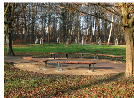
Der nördliche holländische Garten wurde 2020 fertiggestellt