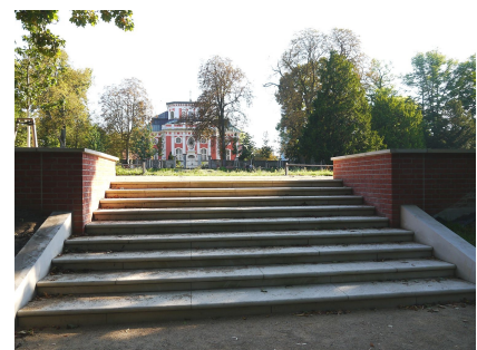
Sanierte historische Treppe mit Blick zur Schlosskirche