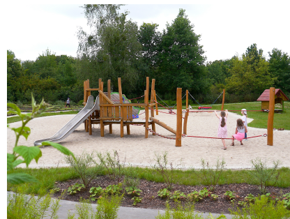
Der Spielgarten ist fertig