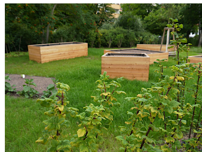
Neben einem Wasserspielplatz gibt es auch einen Naschgarten und Hochbeete