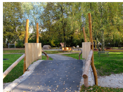
Brücke auf dem Asphalttrundweg