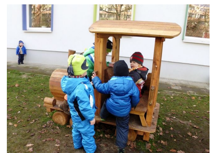
Die Eisenbahn im Kleinkinderbereich