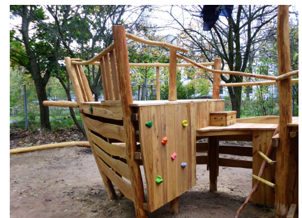
Detail des neuen Spielschiffes