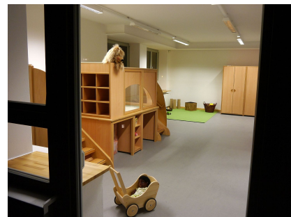
Die Gruppenräume sind funktional ausgestattet