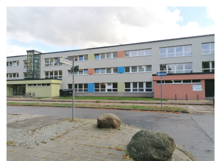
Das langgestreckte Gebäude verfügt über zwei Aufzüge