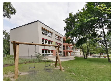
Die sanierte Kita "Bucher Wichel"