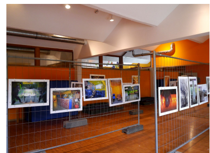
Der neue Tanzsaal mit großen Spiegeln wird auch für Ausstellungen genutzt