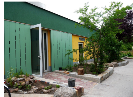
Das sanierte Gebäude des Kinderklubs "Würfel"