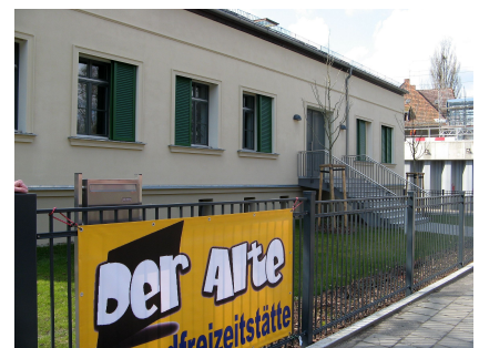
Die Jugendfreizeiteinrichtung an der Wiltbergstraße