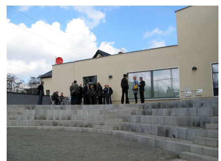
Treffpunkt Innenhof mit Sitzstufen