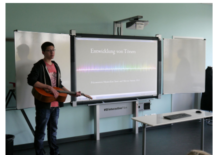
Ein großer Teil der Klassenräume ist mit digitalen Tafeln ausgestattet