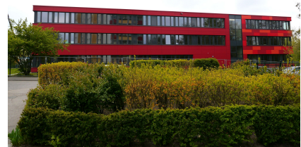
Der Ergänzungsbau im Wohngebiet an der Walter-Friedrich-Straße