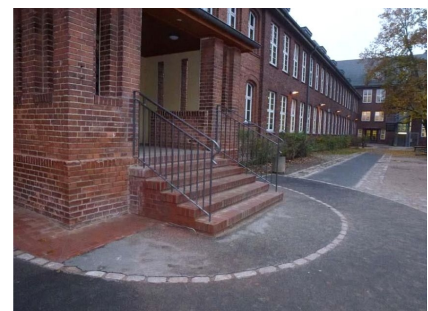
Das Fundament ist dicht - Eingang der Grundschule