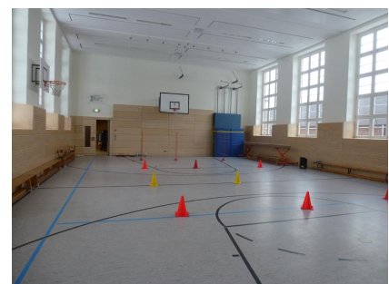
Die sanierte Sporthalle mit Prallwand, Akustikdecke und neuen Fenstern