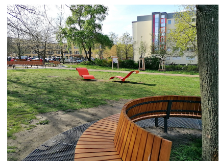
Auch auf der Wiese kann man im Schatten oder in der Sonne entspannen