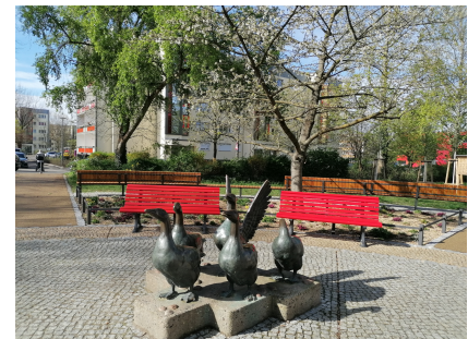
Die Gänseplastik auf dem Schmuckplatz mit vielen Bänken