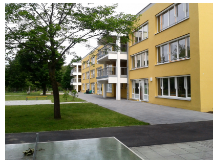
Nach der Fertigstellung