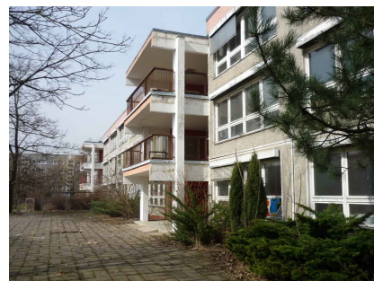
Die Gartenseite vor dem Umbau